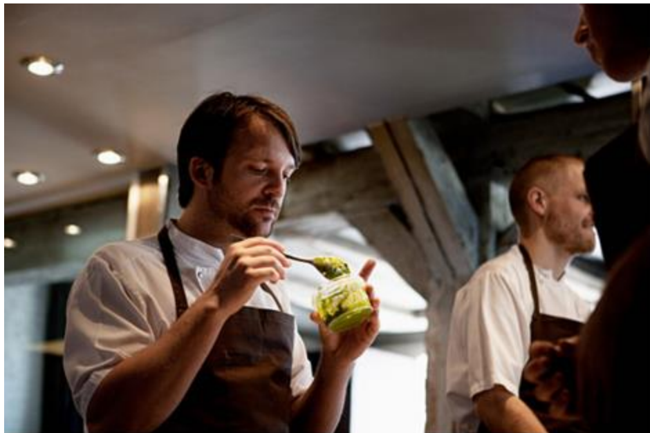
「ノーマ」のシェフ、レネ・レゼビ

デンマークの高級店「noma」が2024年末に営業終了を決定。革新的なレストランを続けるために、労働集約的で、莫大なコストがかかることが原因とオーナーは語る。