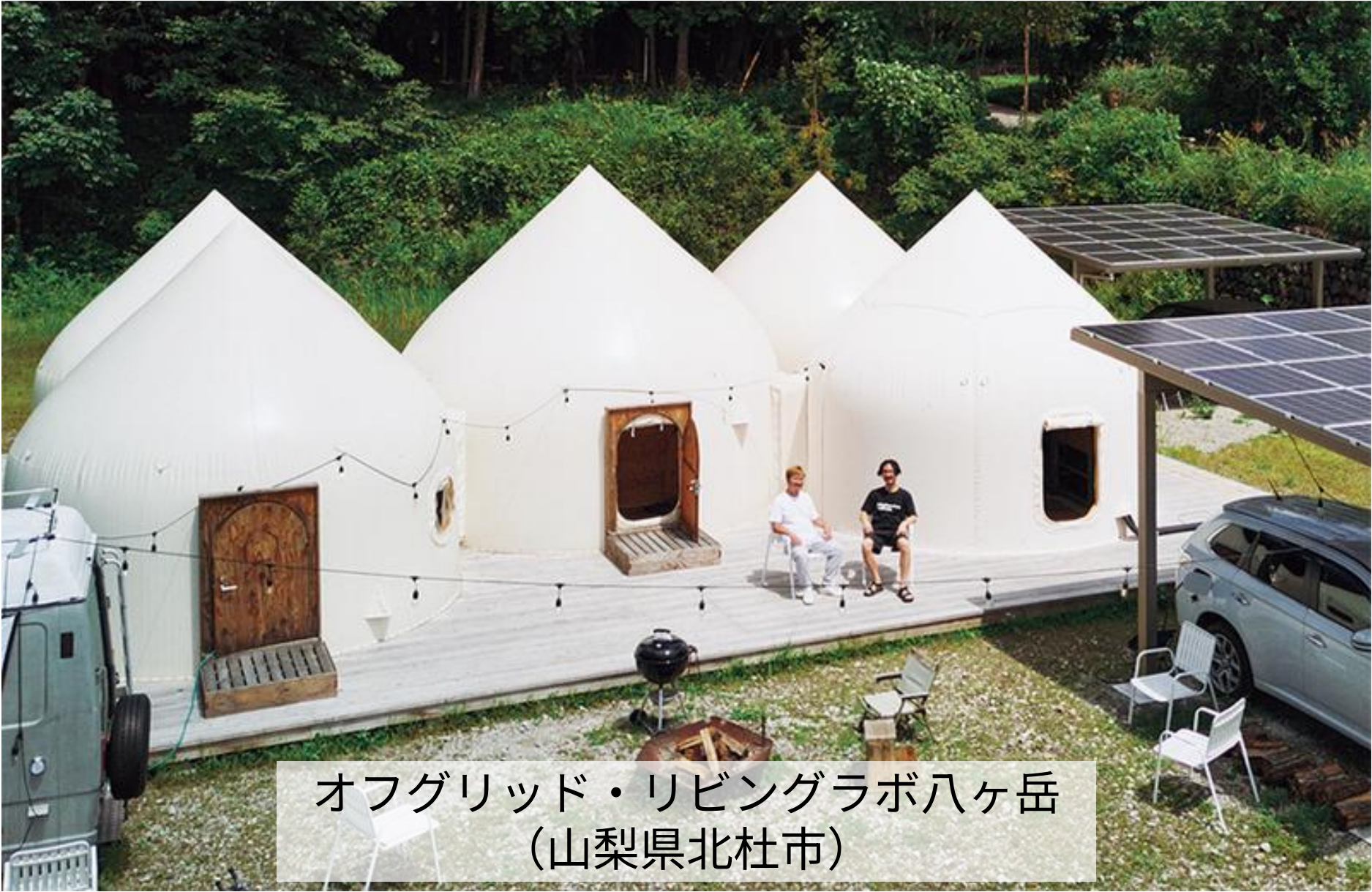
オフグリッド・リビングラボ八ヶ岳 (山梨県北杜市)